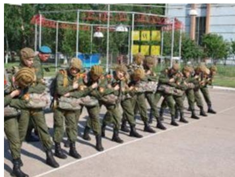
Тренировки перед прыжком