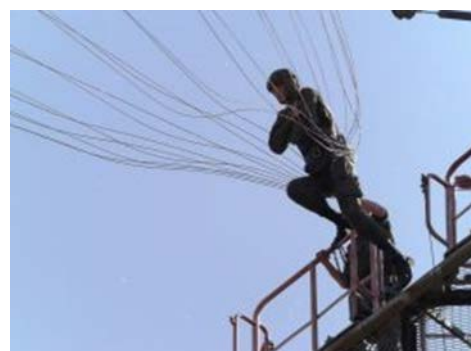
Тренировочный прыжок с вышки