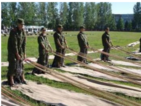
Учатся складывать парашют