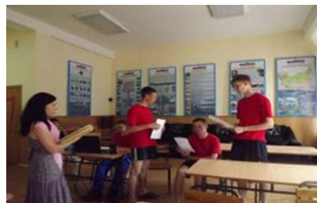
Подготовка к допросу военнопленного